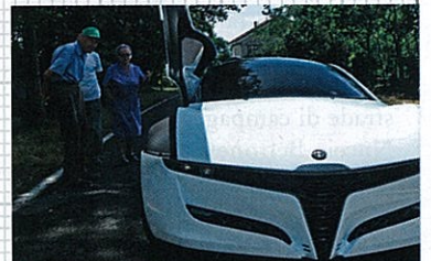
SCARICHI A SALAME...

sarebbero finite con lo sbattere contro qualche pesca sui rami. Fortunatamente no... Ripartiamo: gli specchietti (retrovisori, interni ed esterni) non ci sono: al loro posto retrocamere che riproducono su monitor LCD quello che accade dietro. Il che può andare bene su un'automobile spaziale, ma francamente, per la guida di tutti i giorni, bisogna prenderci la mano. Non è una cosa immediata. Il nostro giro continua insieme a Mike, che non smette di illustrare le particolarità del modello: mi garantisce che nella versione definitiva, ammesso che vada in produzione, le porte non saranno così ingombranti. Avranno lo stesso meccanismo d'apertura, ma il parafrangente non salirà assieme al resto. Siccome l'auto è tutta chiusa e non ci sono i vetri elettrici, ci hanno messo un condizionatore. È lì perché serve per evitare che il possibile cliente si senta in una serra tropicale. Funziona, come funzionano gli interruttori che ci sono (pochi